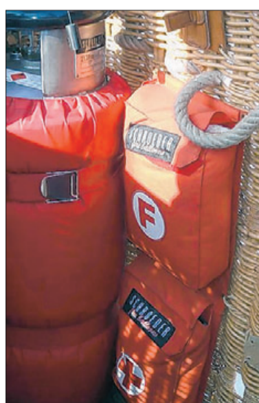
Auch für den Notfall ist gesorgt.