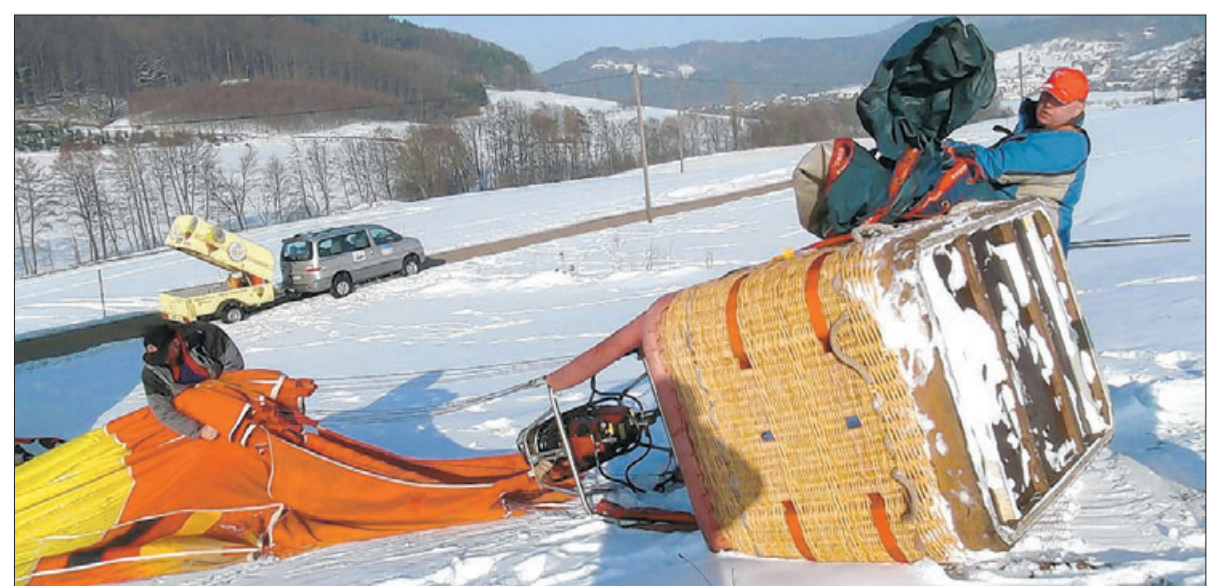
Glücklich gelandet: Das zuverlässige Verfolgerteam ist schon mit Fahrzeug und Hänger zur Stelle, der Ballon wird abgerüstet.