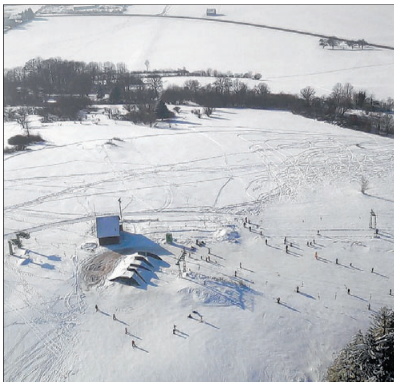
Viel Betrieb auf den Skihängen am Kriegsburren bei Treffelhausen.