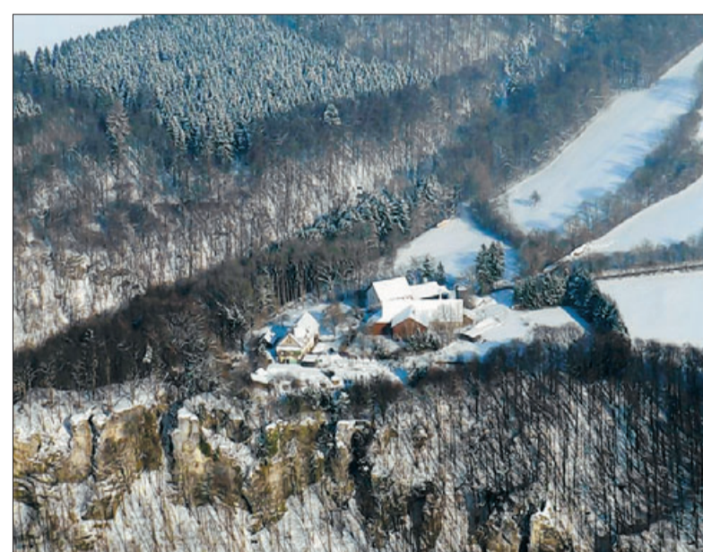
Der Weiler Ravenstein auf den Felsen über dem Roggental.