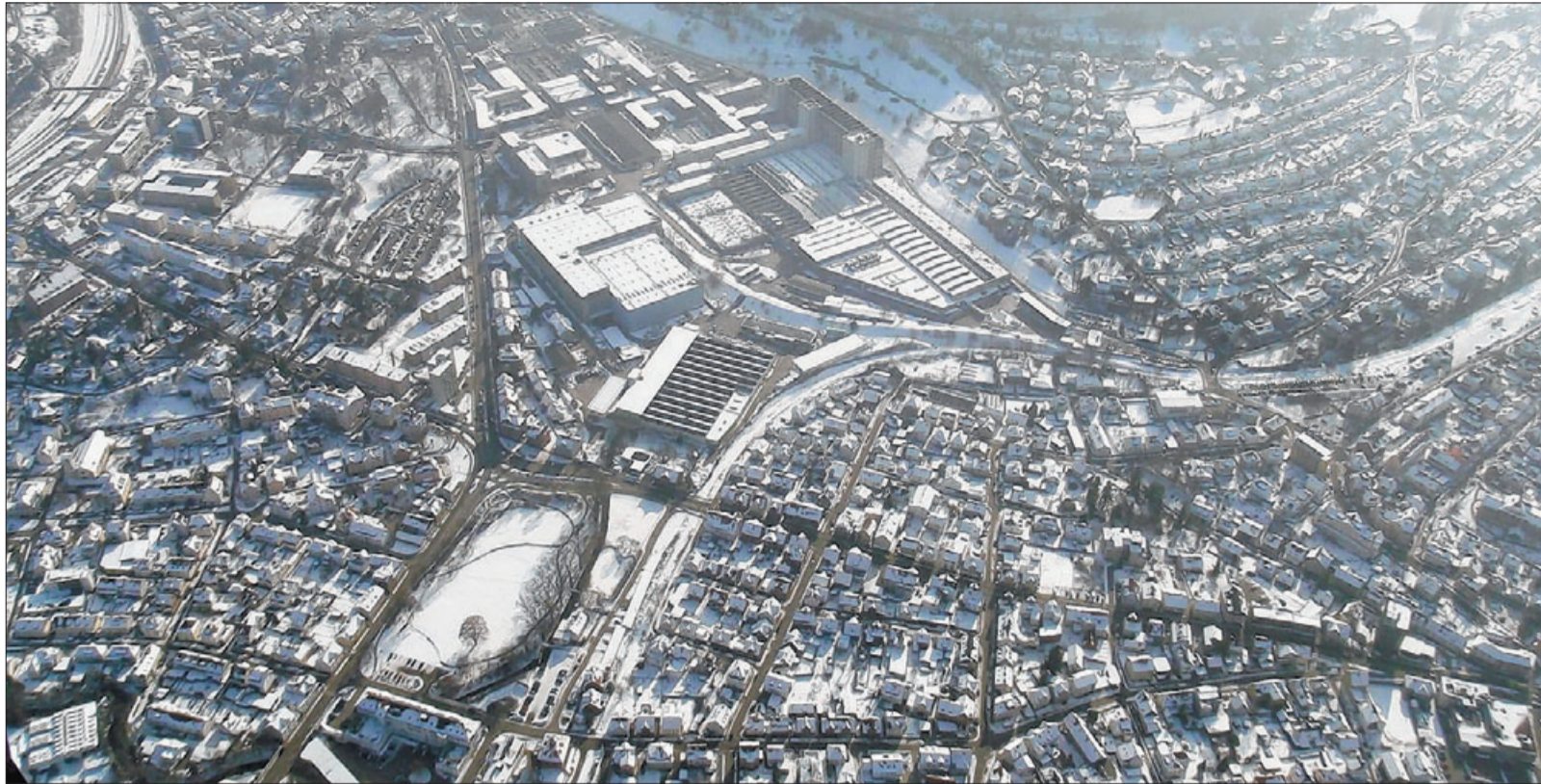
Bald ein historisches Bild? Links unten der Städtische Sportplatz – unbebaut –, darüber das große Werksareal der Geislinger WMF.