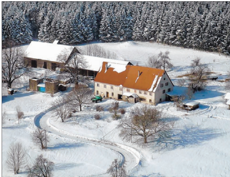
Zum Greifen nah: Der Lützelalbhof am Wald über Weißenstein.