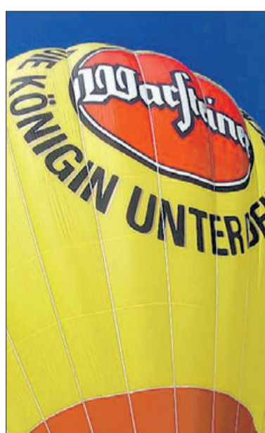
Die Hülle ist gefüllt – fertig zum Start.