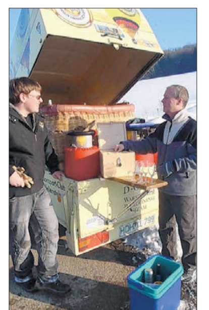
Die Ballonfahrer-Taufe wird vorbereitet.