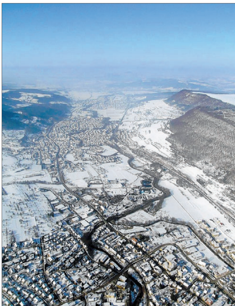
Der Blick über Altstadt und Kuchen talabwärts in Richtung Göppingen.